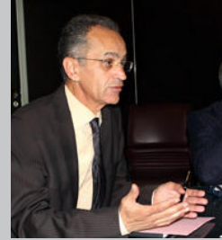
عز الدين المنتصر بالله المدير العام للوكالة الوطنية لتقنين المواصلات

بحلول السابع عشر من نوفمبر 2014. يكون قطاع الاتصالات قد قطع مرحلة جديدة من مسلسل تطوره وفق المخطط الوطني لتنمية الصبيب العالي و العالي جدا المصادق عليه سنة 2012.